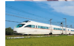
小田急ロマンスカーVSE