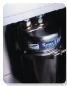
スーツァンレストラン陳